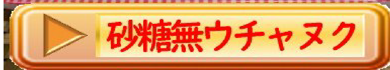
砂糖無ウチャヌク