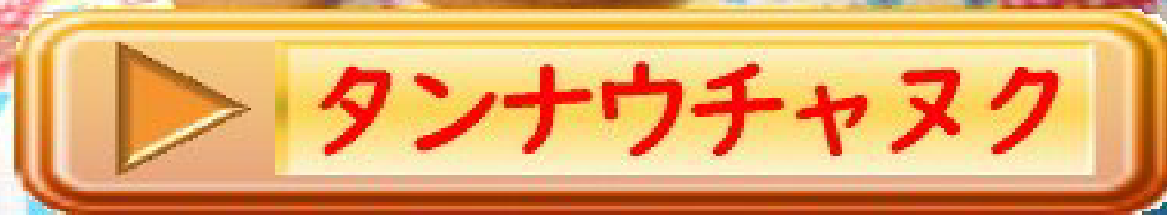
タンナウチャヌク